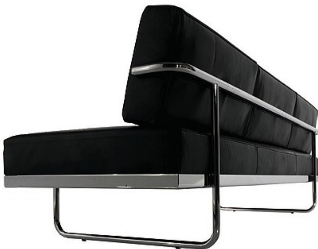
Canapè - Le Corbusier 1934

In occasione della sistemazione del suo appartamento nel 1934, Le Corbusier realizzò uno studio su un divano a tre posti da poter convertire in letto singolo, ribaltando semplicemente lo schienale